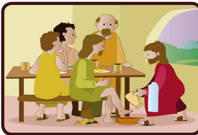
Il verse de l'eau dans une bassine et lave les pieds de ses apôtres.