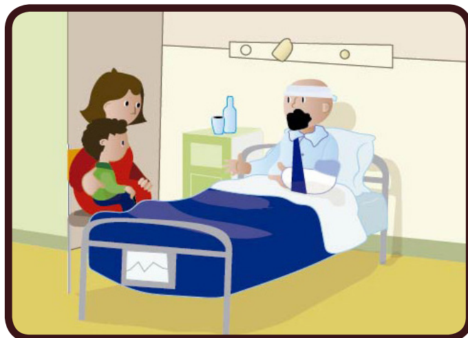
Mon papa a eu un grave accident de voiture. Il a dit que c'est Jésus qui l'a aidé à s'en sortir.