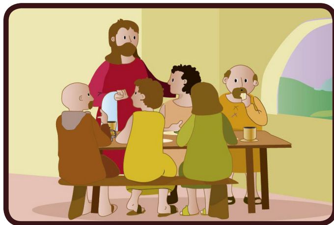
Durant le dernier repas avec ses disciples, Jésus se lève de table, et prend un essuie-main .

« Si je vous ai lavé les pieds, moi, le Seigneur et le Maître, vous devez vous aussi vous laver les pieds les uns aux autres » (Jean 13,14).