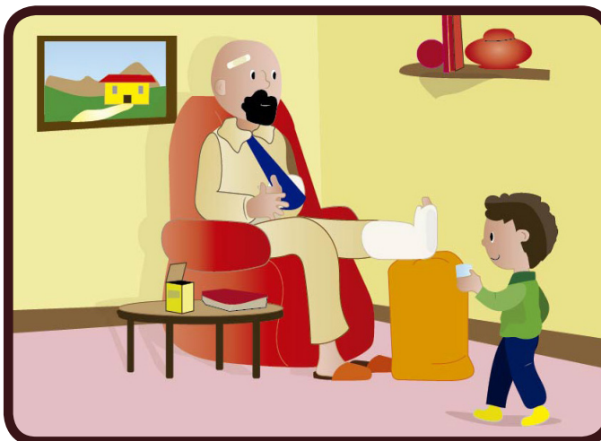
Lorsqu'il est revenu à la maison, j'avais beaucoup d'occasions de faire des actes d'amour pour l'aider : je lui donnais un verre d'eau, je lui apportais ses pantoufles, un médicament...