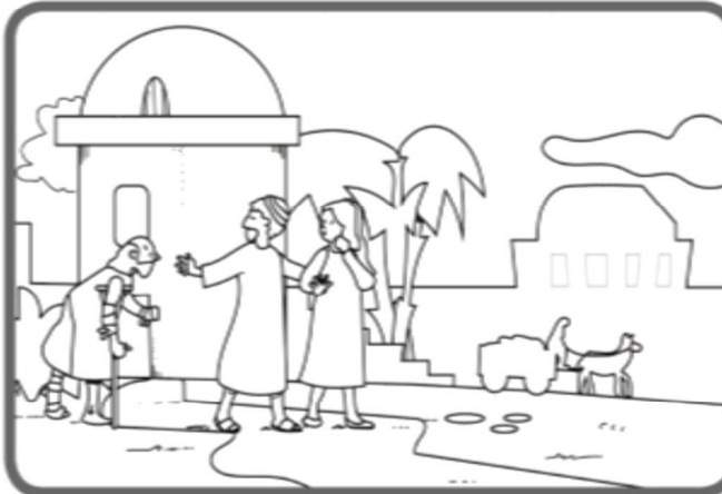
A son époque aussi, beaucoup de personnes souffraient de graves injustices : pauvreté, manque de liberté.