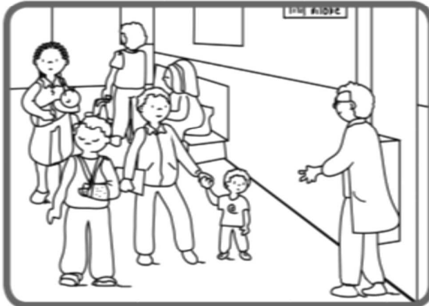
. Iyo Salomon du Gabon - Un jour, j'étais malade, alors mon papa m'a accompagné à l'hôpital, où travaille un médecin qui est son ami. Lorsque nous sommes arrivés, il y avait beaucoup de monde qui attendait, mais l'ami de papa nous a tout de suite accueillis.