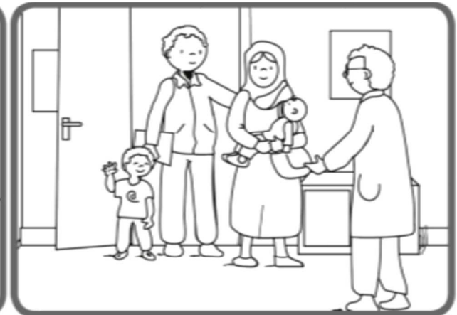
Alors je lui ai dit : « Papa, quand tu arriveras au Paradis, Jésus te dira : "C'est à moi que tu l'as fait". Papa a accepté d'aider cette maman. Alors nous sommes allés trouver son ami médecin avec l'enfant et sa maman. Après l'examen médical, nous nous sommes salués. J'étais très heureux.