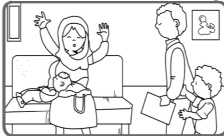
En sortant du cabinet du médecin, nous avons rencontré une dame musulmane qui pleurait très fort, car son enfant allait très mal et aucune personne de l'hôpital ne voulait la recevoir à cause du conflit entre chrétiens et musulmans. Mon papa lui aussi, est passé près d'elle sans rien faire. J'ai insisté, mais il m'a dit qu'il était là pour s'occuper de moi.