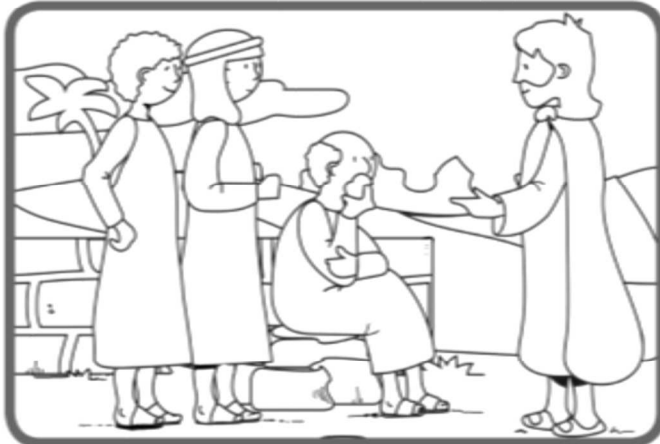
Jésus a enseigné à ses disciples que la justice de Dieu, c'est Son amour infini pour tous les êtres humains.

« Tu rechercheras la justice, rien que la justice » (Deutéronome 16, 20)