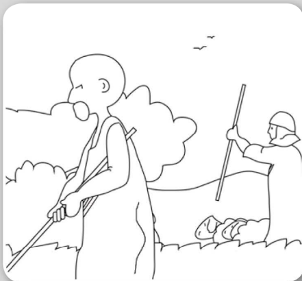
Malheureusement Caïn était jaloux d'Abel.