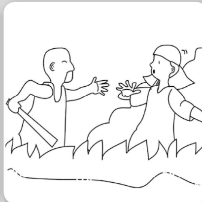
Alors un jour, plein de rancœur, il oublia qu'il était son frère et le tua.

Cependant, Dieu n'arrête jamais de nous aimer et il nous a envoyé Jésus pour réunir ses enfants en une seule famille.*