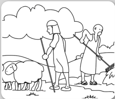
La Bible nous raconte : Caïn et Abel étaient deux frères. Le premier était paysan et l'autre pasteur.